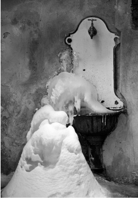
Eine Bassena am Gang im Winter.

als vielversprechender, als Anleihen bei einer Bank aufzunehmen. Dieser Logik folgend wurde die Miete der Bewohner als »Zins« bezeichnet. Bis heute gelten diese Bauformen offiziell als »Altbauten«. Die Wohnungen werden umgangssprachlich als »Bassenawohnungen« bezeichnet: Die Wasserentnahmestelle am Gang wurde nach dem italienischen bacino oder dem französischen bassin Bassena genannt. Der Wasserhahn musste in eisigen Wintermonaten mit Fetzen umwickelt werden, um ein Gefrieren des Wassers und die damit verbundene Sprengung der Leitungen zu verhindern. Oft wurden Abfälle in die Bassena geschüttet und dadurch verstopft. Es folgte ein hausinternes Detektivspiel: Welcher Dreckskerl war das Saubartl? Auch dass Kinder im Sommer an der Bassena Pritschelpartien abhielten, förderte nicht die Solidarität der Hausbewohner. Rar waren die Spielplätze, die Kinder konnten entweder auf die Straße ausweichen, noch war der Verkehr in den Seitengassen übersichtlich, oder im jeweiligen Stockwerk herumtollen.