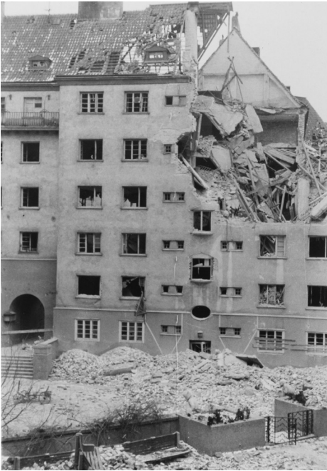
Der Reismannhof in Wien-Meidling im Jahr 1945. Die Wohnungsnot nach dem Krieg war groß.

Doch es gibt auch Erfreuliches zu berichten. In der Zwischenkriegszeit begann die Gemeinde Wien eine prinzipiell neue Variante des Wohnbaus: Sie trat dabei selbst als Trägerin auf und ermöglichte dadurch die Errichtung der Gemeindebauten. Freilich herrschten auf dem Wohnmarkt damals andere Voraussetzungen: Der private Wohnungsbau war nach dem Ende des Ersten Weltkriegs fast völlig zusammengebrochen und die nunmehr in der Stadt regierenden Sozialdemokraten hatten andere Prioritäten als die vordem herrschenden Politiker der christlich-sozialen Partei. Eines der wichtigsten Ziele – neben Bildung und Gesundheit für alle – war die Schaffung von bezahlbaren und gesunden Wohnungen. Also errichtete die Gemeinde mit den besten Architekten der Stadt die »Gemeindehöfe«, bei denen sich die Wohneinheiten stets um Innenhöfe gruppierten. Die Zahl der hellen und für Licht, Luft und Sonne sorgenden Innenhöfe war variabel. Die Verbauungsdichte der »Gemeindehöfe« war auf 30 Prozent limitiert, oft befanden sich in den Innenhöfen Schwimmbäder und