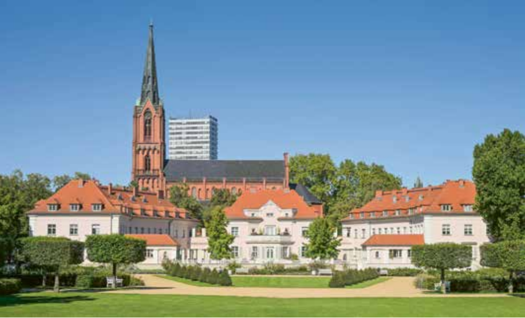
Anger-Park, im Hintergrund die St. Gertraudkirche

auf dem Territorium Polens gehört. Derzeit ist die Kirche des Schutzes der Allerheiligsten Muttergottes nur zu den Gottesdiensten zu besichtigen.