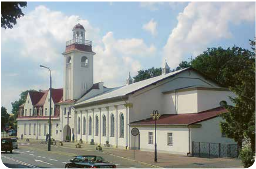
Oben links: Heiliggeistkirche. Oben rechts: Pfarrkirche der Allerheiligsten Jungfrau Maria. Unten: Kirche des Schutzes der Allerheiligsten Muttergottes

geführte Sakralbau in Stubice. Um sie und die anderen Kirchen in Stubice zu besuchen, überquert man die Oderbrücke und hält sich sofort rechts. Vom Grenzübergang führt der Oderdamm, ein zwischen Straße und der Wasserfläche des Stubicer Hafens erhabener geführter Fuß- und Fahrradweg, in etwa zwanzig Minuten zu einer Besonderheit unter den Kirchen der Doppelstadt an der Oder.