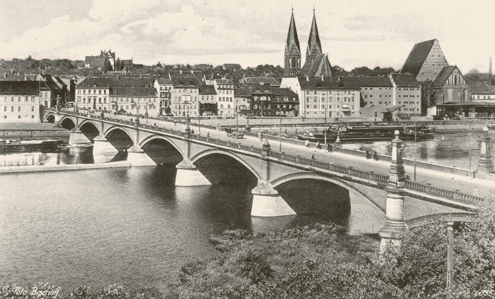
Stadtbrücke, Ansicht vor 1933

Studien machen konnte«. Die Universität beförderte Lebensart und Künste, in Frankfurt wurde komponiert und musiziert, Theater gespielt, gedichtet und verlegt.