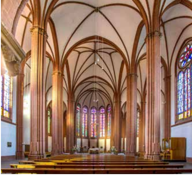
Links: Die Katholische Heilig-Kreuz-Kirche. Rechts: Innenraum der Heilig-Kreuz-Kirche

derstand der katholischen Kirche, und so zeugt der repräsentative Kirchenneubau von der moralischen Stärkung der una sancta im Ergebnis dieses Konfliktes. Auch im gegenwärtigen Frankfurt ist der Turm der katholischen Kirche ein weithin sichtbares Element des Stadtbildes.