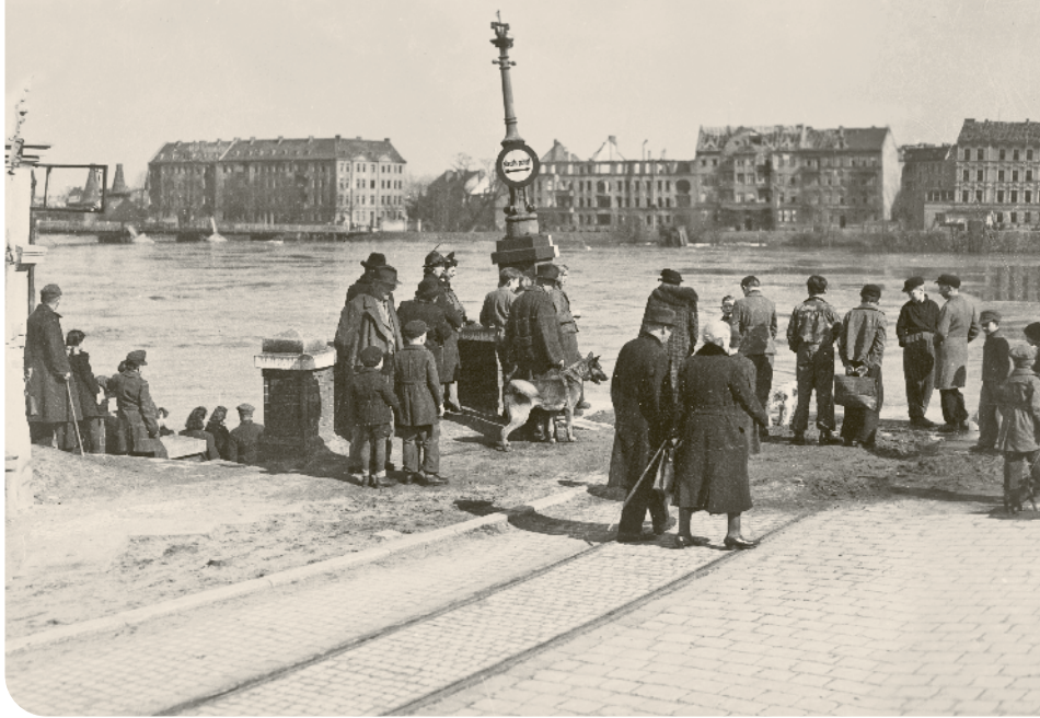
Die Oderpromenade 1945

es – anders als auf den nahegelegenen Seelower Höhen – gar nicht zu größeren Kampfhandlungen gekommen; vielmehr war die Stadt evakuiert und fast menschenleer, als ein Großbrand tagelang in den dichtbebauten und engen Straßen der Frankfurter Kernstadt tobte. Niemand war da, der hätte löschen können; die Frage nach der Ursache des Brandes ist bis heute nicht eindeutig beantwortet. Umso klarer war das Ergebnis: Das alte Frankfurt hatte aufgehört zu existieren. Zudem wurde entlang der Oder eine neue Staatsgrenze gezogen, die fortan die Sowjetische Besatzungszone – die spätere DDR – von Polen trennte. Auf dem Ostufer, der Dammvorstadt, fand ein vollständiger Bevölkerungsaustausch statt. Menschen aus verschiedenen Teilen des polnischen Vorkriegsterritoriums wurden hier – staatlich gelenkt – angesiedelt und bildeten nun die neue Stadtgemeinde namens Słubice. Ebenso wie Słubice war Frankfurt (Oder) nun Grenzstadt an einer über Jahrzehnte kaum passierbaren Grenze. Die hohe Präsenzdicke staatlicher Kontrollorgane wie Zoll, Polizei, Grenzschutz und Staatssicherheit drückte beiden Städten einen tiefen Stempel auf.