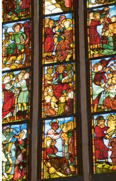
Links: Innenraum der Marienkirche. Rechts: Kirchenfenster mit der Darstellung des Antichrist-Zyklus

lockt und sich selbst an die Stelle Gottes setzen will. Die Bilder sind drastisch, sie zeigen das zynische Gesicht des Teufels, sie schildern falsche Predigten, Menschen, die dem Verräter folgen, und vielfach Szenen sadistischer Gewalt, bis am Ende der wahre Sohn Gottes zum Jüngsten Gericht erscheint.