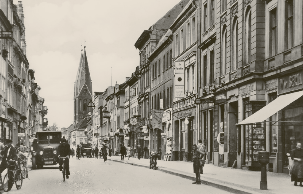
Straßenansicht vor 1933

in die Stadt; nicht zuletzt sie waren es, denen die Stadt die sehr repräsentative Erweiterung nach Westen verdankte. Man spaziere nur einmal die Straße mit dem merkwürdigen Namen Halbe Stadt entlang – hier hat der Bürger- und Beamtenstolz des 19. Jahrhunderts prächtige Zeugnisse hinterlassen.