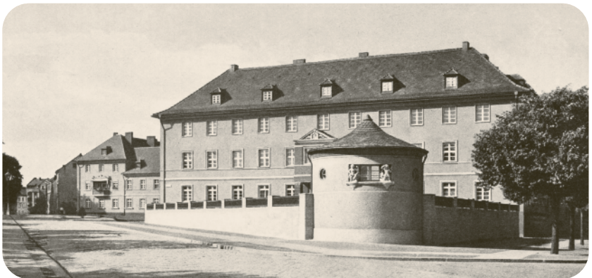
Reichsbahndirektion Osten in Frankfurt, um 1923

Das Jahr 1945 ist in mehrerlei Hinsicht eine der tiefsten Zäsuren der Stadtgeschichte. Wenige Wochen vor dem Ende des Krieges verbrannte das Frankfurter Stadtzentrum fast völlig. Dabei war