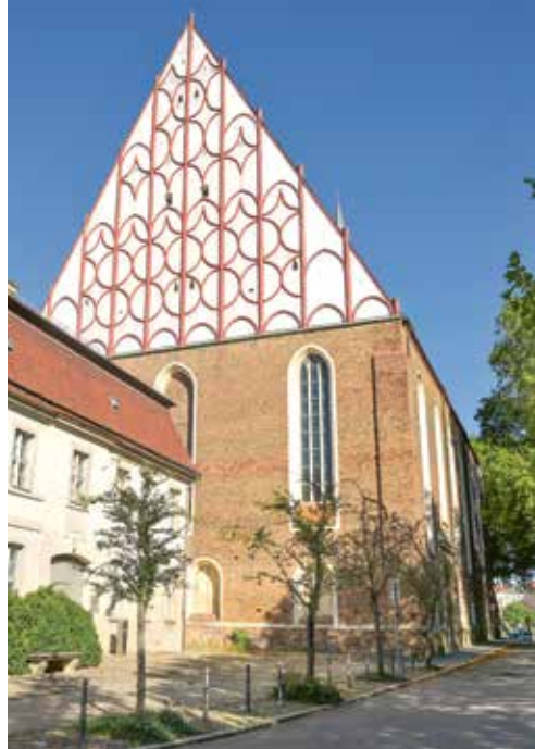
Links: Die Nikolaikirche / Friedenskirche, heute Oekumenisches Europa-Centrum Rechts: Die einstige Franziskaner-Klosterkirche, heute Konzerthalle »Carl Philipp Emanuel Bach«

Friedrich Wilhelm I. zur Garnisonkirche umgebaut. Der letzte Gottesdienst fand hier 1945 statt. Seit 1967 wird die Franziskanerkirche als Konzerthalle genutzt, das Brandenburgische Staatsorchester hat hier seinen Sitz.