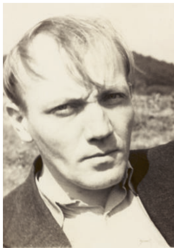
15 Hans Uhlmann in Moskau, 1932