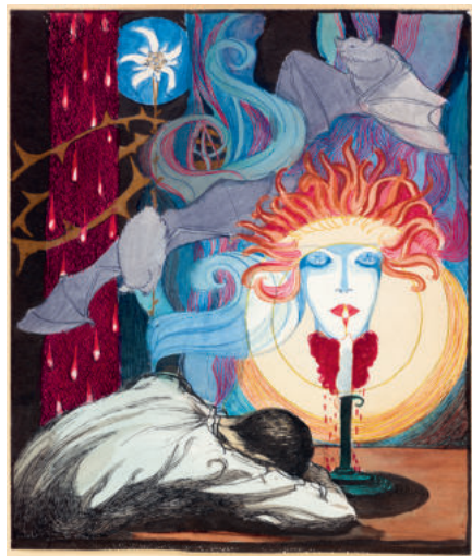
5 Mann und Medusa, zwischen 1910-14