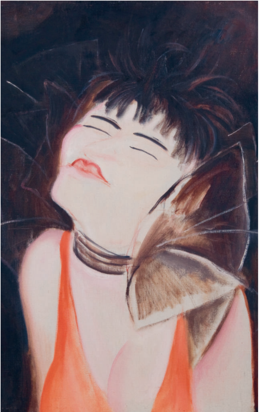
8 Valeska Gert, vor 1929