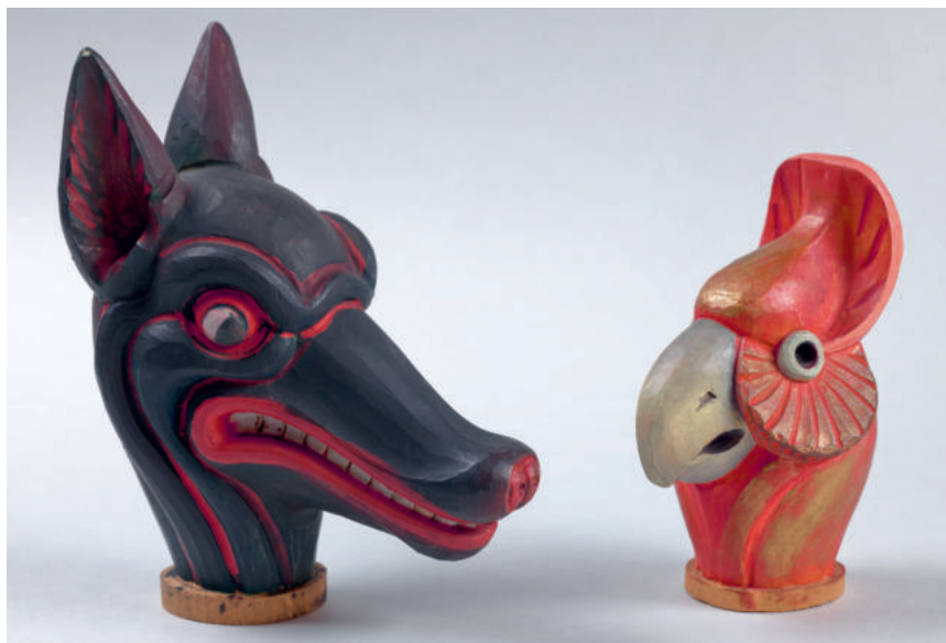
14 Handpuppenköpfe für das Reichsinstitut für Puppenspiel im Auftrag von Harro Siegel