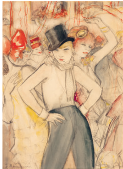
7 Sie repräsentiert! 1928