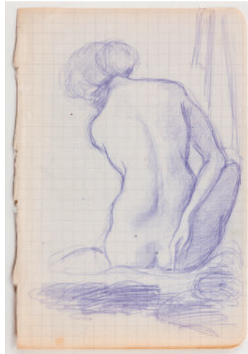
3 Rückenakt, ohne Jahr