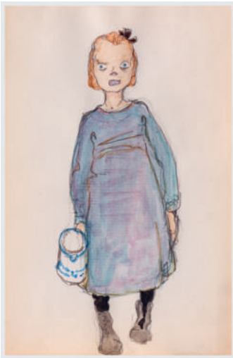
2 Mädchen mit Milchkanne, zwischen 1910-14