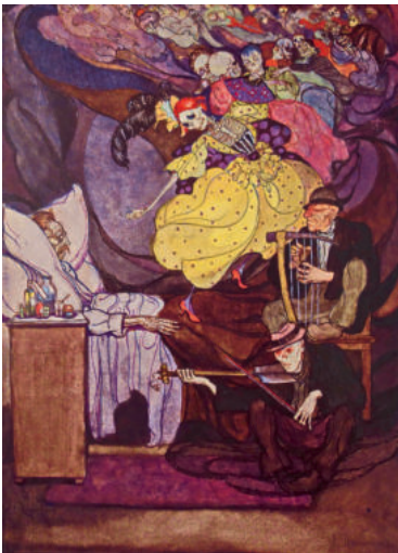
4 Der Totentanz, zwischen 1910-14

Jeanne und Mimi zog es 1908 weiter zum Studium nach Brüssel. An der dortigen Académie Royale des Beaux-Arts, an der beide Schwestern mit kurzen Unterbrechungen 1910 ihr Studium abschließen konnten, stand vor allem der Symbolismus im Zentrum der Kursangebote. Träumereien und Illusionen, die eng verknüpft sind mit der zeitgenössischen Literatur, die Jeanne damals begeistert konsumierte, prägen ihre frühen Aquarelle und Motive. Auch Phantastisches und Mysteriöses reizte sie zu neuen Bilderfindungen, die sie literarisch in E.T.A. Hoffmanns Erzählungen fand. Von ihren symbolistischen Werken 1 haben sich Illustrationen zu Gustave Flauberts 1874 erschienener La Tentation de Saint Antoine , das zu den Lieblingsbüchern von Jeanne zählte, erhalten. Für diesen Zyklus erhielt sie 1909 in Brüssel die Medaille für Komposition, eine Auszeichnung, auf die sie zu Recht stolz war.