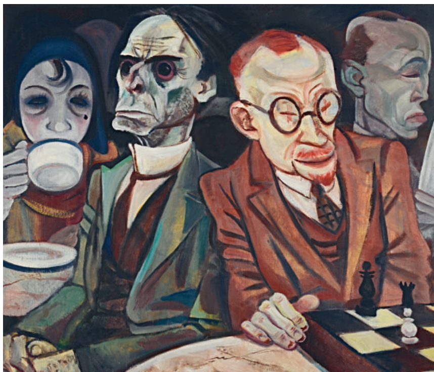
9 Schachspieler, 1929/30

»Echt weibliche Buntheit und Nuancenfreudigkeit«, hatte ihr im zur Ausstellung erschienenen Katalog Hermann Sinsheimer 7 attestiert, ein Freund aus der gemeinsamen Arbeit bei der Zeitschrift Simplicissimus . »Gezeigt wurden 19 Gemälde sowie eine Auswahl von Zeichnungen, Aquarellen und Lithographien. Um welche Arbeiten es sich konkret handelte, ist kaum noch zu rekonstruieren«, schreibt Annelie Lütgens. 8 Zwei herausragende Gemälde aber, die dort ausgestellt waren, können identifiziert werden: Valeska Gert als Chansonette und Schachspieler , beide heute im Besitz der Berlinischen Galerie. Ausdrucksstark und aktuell präsentierte sich Jeanne Mammen 1930 mit diesen Arbeiten, war doch Valeska Gert eine bekannte Ausnahmekünstlerin. Sie galt als Exzentrikerin, ihre Ausdruckstänze waren im damaligen Berlin legendär.