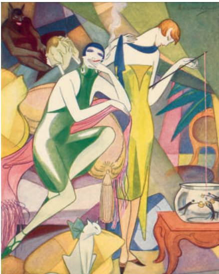
6 Goldfischfang, um 1925